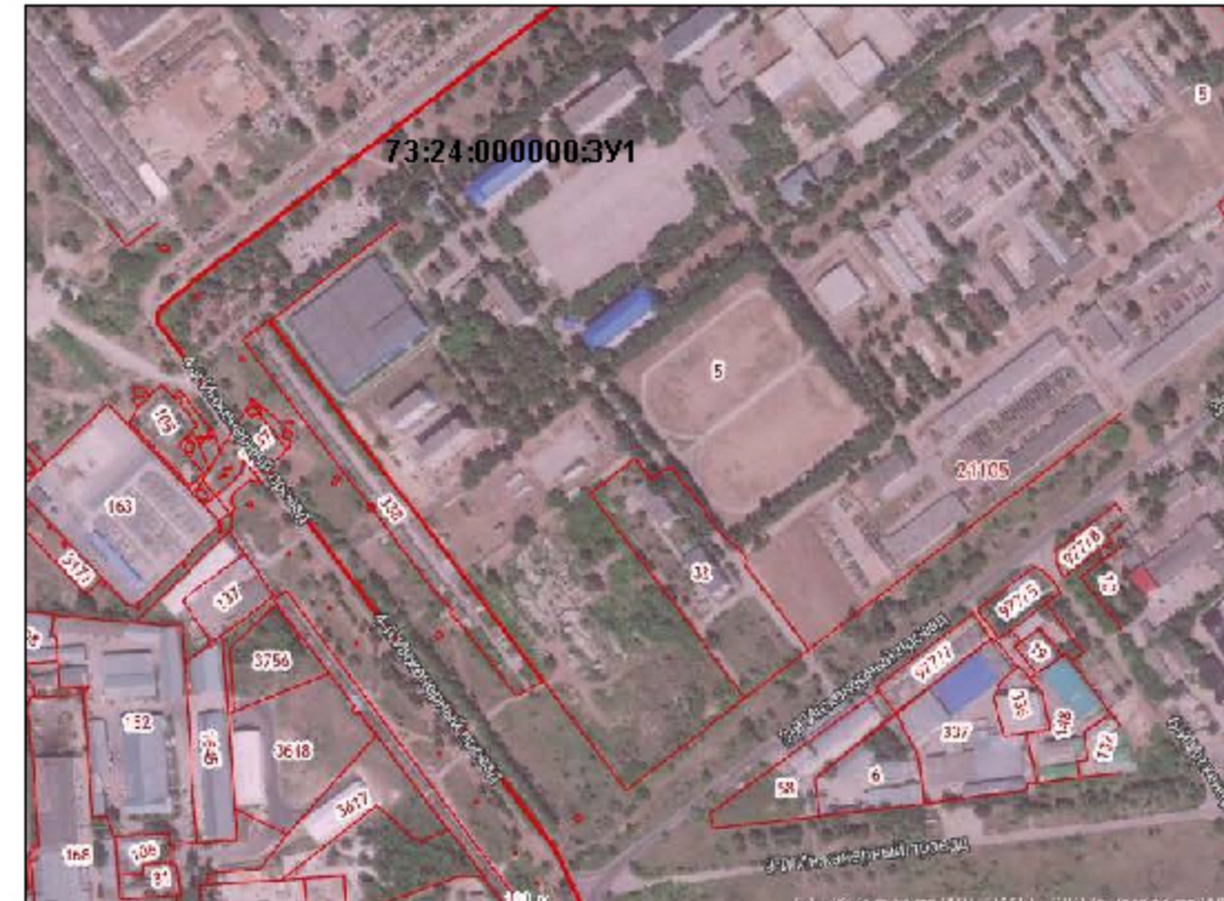
Схема расположения публичного сервитута в отношении земельных участков и (или) земель, в целях размещения, объекта электросетевого хозяйства "Электросетевой комплекс 10-0,4 кВ ВЛ 10 кВ яч. № 411 ПС 110/10 кВ «Восточная» на кадастровом плане территории кадастровых кварталов 73:24:021105, 73:24:021101, расположенного по адресу: Ульяновская область, г. Ульяновск